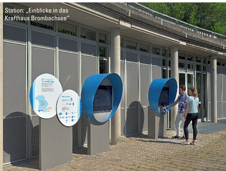
Station: „Einblicke in das Krafthaus Brombachsee“