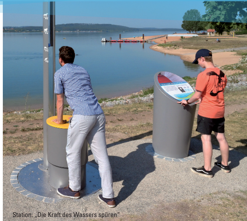
Station: „Die Kraft des Wassers spüren“

Darüber hinaus lohnt sich ein Besuch des Infozentrums Seenland. Öffnungszeiten im Sommerhalbjahr: täglich von 10 bis 16 Uhr